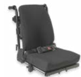
Rücken: ATA 2174, 2175