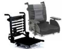
Rücken: ATA 2171