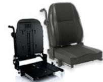
Rücken: ATA 2172 bzw. 2173