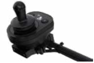
2231 / 2232